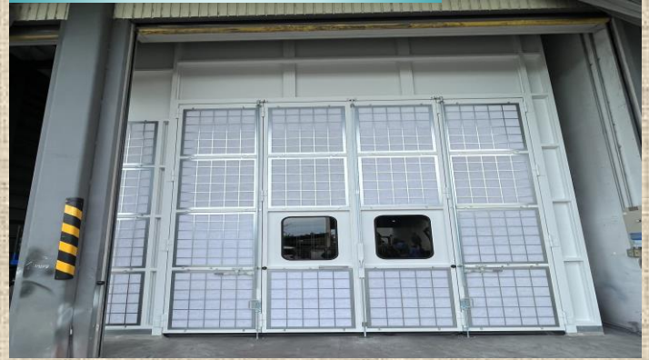
自然給気型水平気流